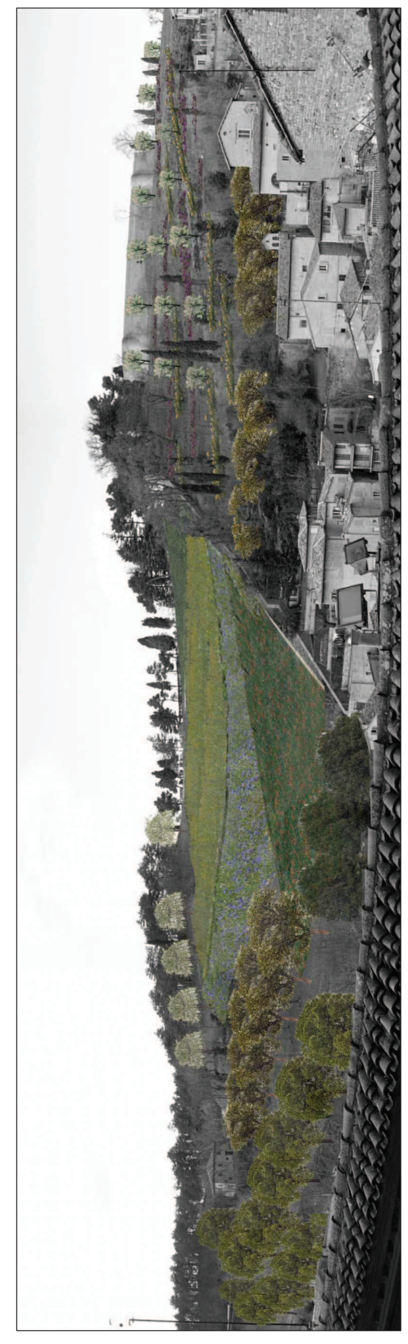
Simulazione dei prati fioriti (ambito "la Lavagna")