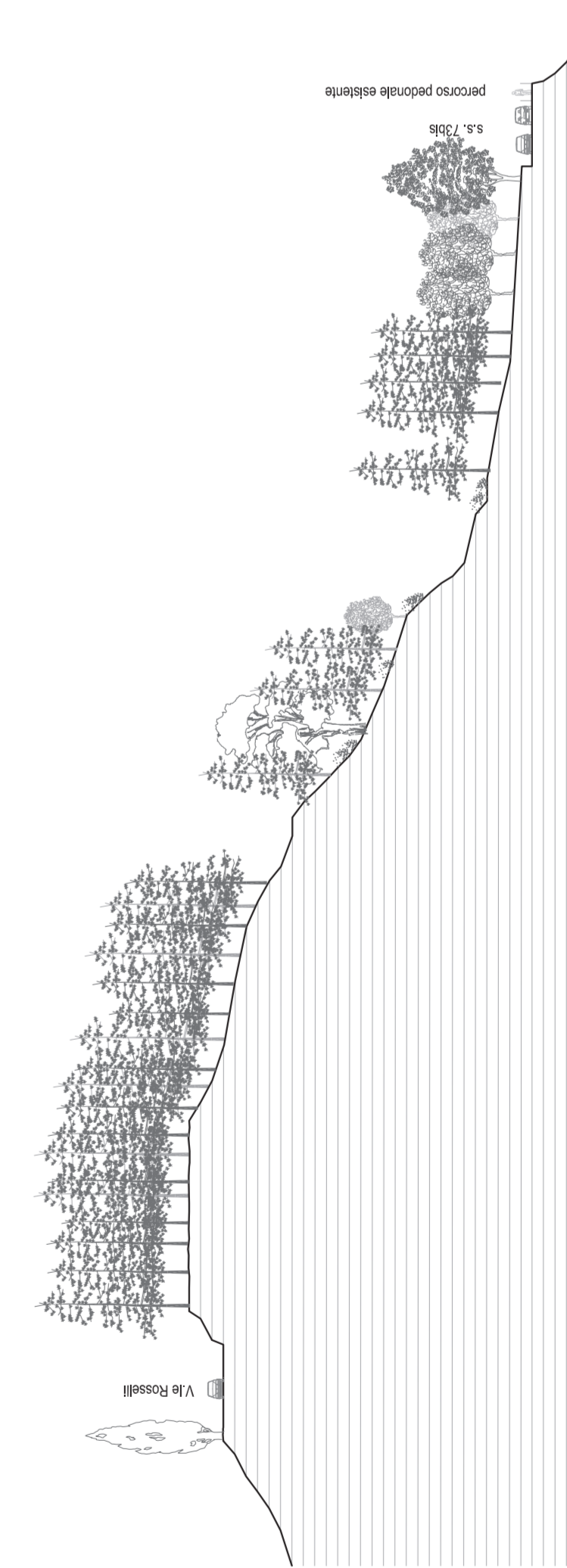
SEZIONE 2-2 - scala 1:500