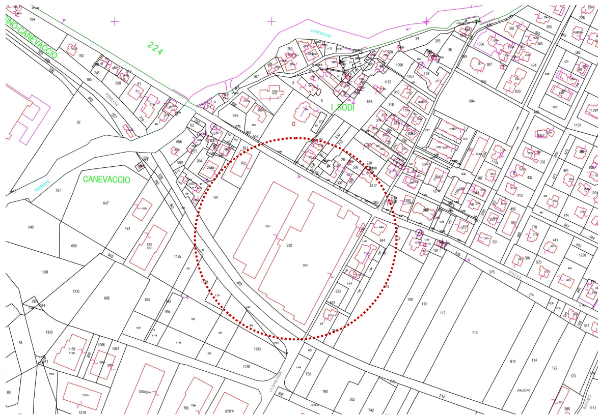
* Stralcio mappa catastale