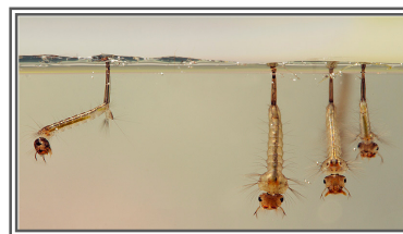
LARVE DI ZANZARA TIGRE

EVITARE I RISTAGNI DI ACQUA DOVE LE LARVE DI ZANZARA PROLIFERANO