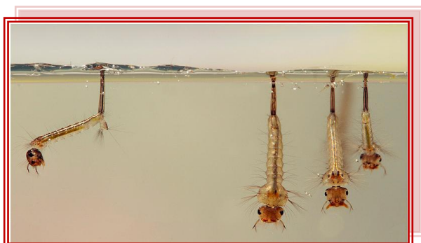
LARVE DI ZANZARA TIGRE

Si informa la cittadinanza che il Comune di Urbino sta continuando lo svolgimento dei trattamenti su tutto il territorio di competenza per contrastare la presenza delle zanzare.