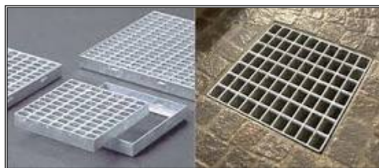
ESEMPIO DI CADITOIA CON RETINA ANTIZANZARE