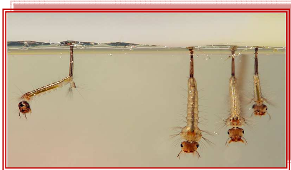
LARVE DI ZANZARA TIGRE

Si informa la cittadinanza che il Comune di Urbino sta continuando lo svolgimento dei trattamenti su tutto il territorio di competenza per contrastare la presenza delle zanzare.