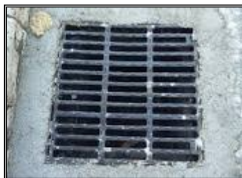
ESEMPIO DI CADITOIA

In alternativa è possibile applicare una rete a maglia fitta (zanzariera), che può essere sistemata sotto la griglia di raccolta delle acque per impedire che le zanzare possano accedere all'acqua e deporre le loro uova, avendo cura di controllare periodicamente l'integrità della rete e di tenerla pulita dai detriti portati dalla pioggia.