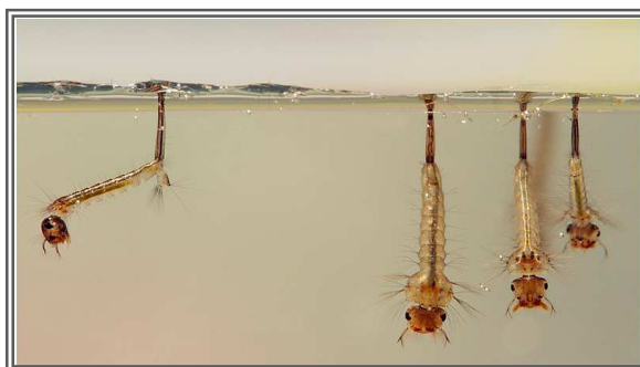
LARVE DI ZANZARA TIGRE

Si informa la cittadinanza che il Comune di Urbino sta continuando lo svolgimento dei trattamenti su tutto il territorio di competenza per contrastare la presenza delle zanzare.