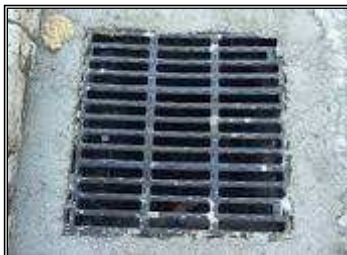
ESEMPIO DI CADITOIA

In alternativa è possibile applicare una rete a maglia fitta (zanzariera), che può essere sistemata sotto la griglia di raccolta delle acque per impedire che le zanzare possano accedere all'acqua e deporre le loro uova, avendo cura di controllare periodicamente l'integrità della rete e di tenerla pulita dai detriti portati dalla pioggia.