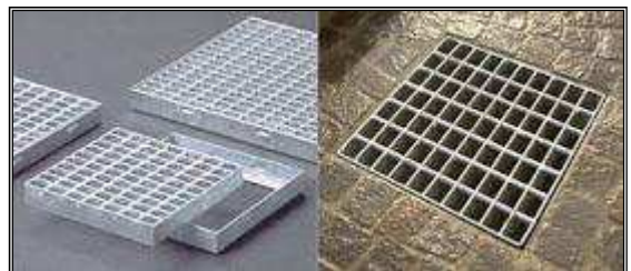
ESEMPIO DI CADITOIA CON RETINA ANTIZANZARE