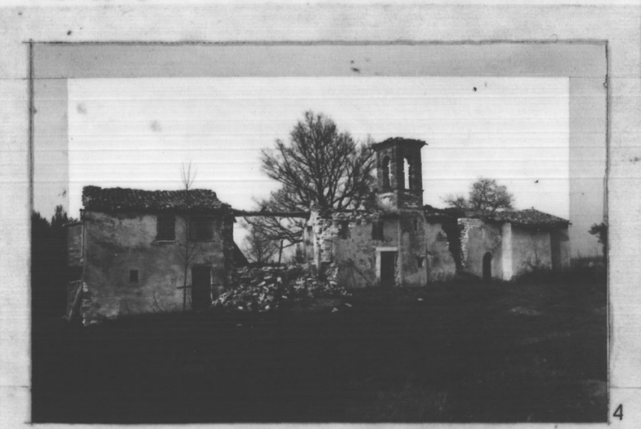
S. Maria delle Selve