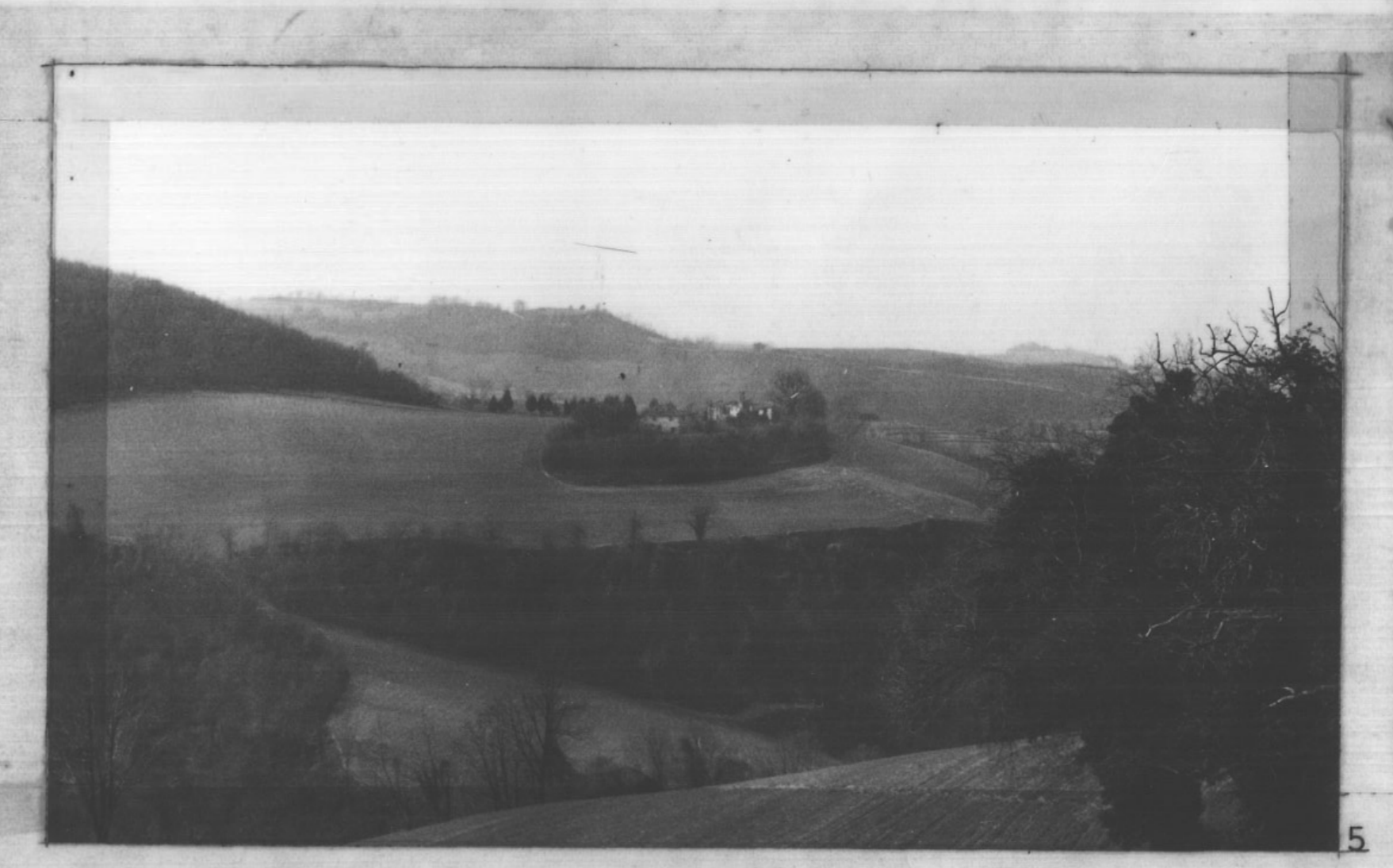
area S. Maria delle Selve