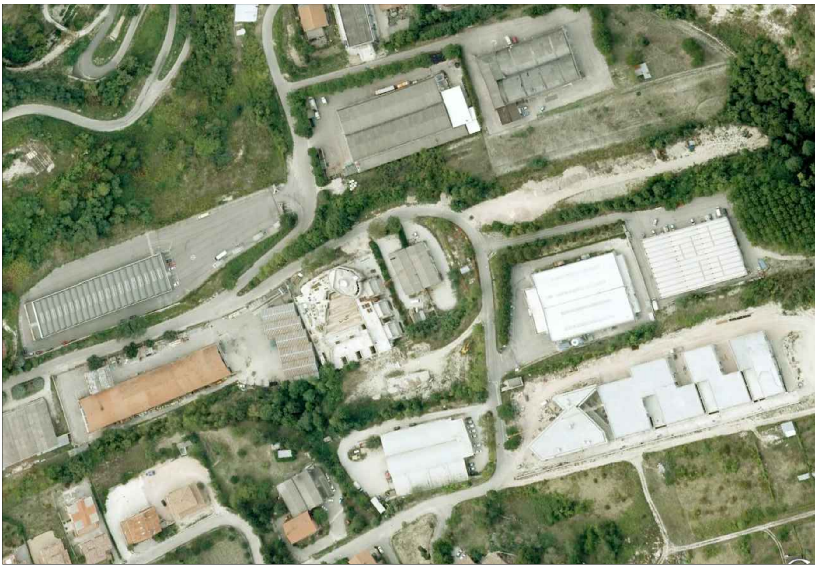
VISTA AEREA DELL'AREA