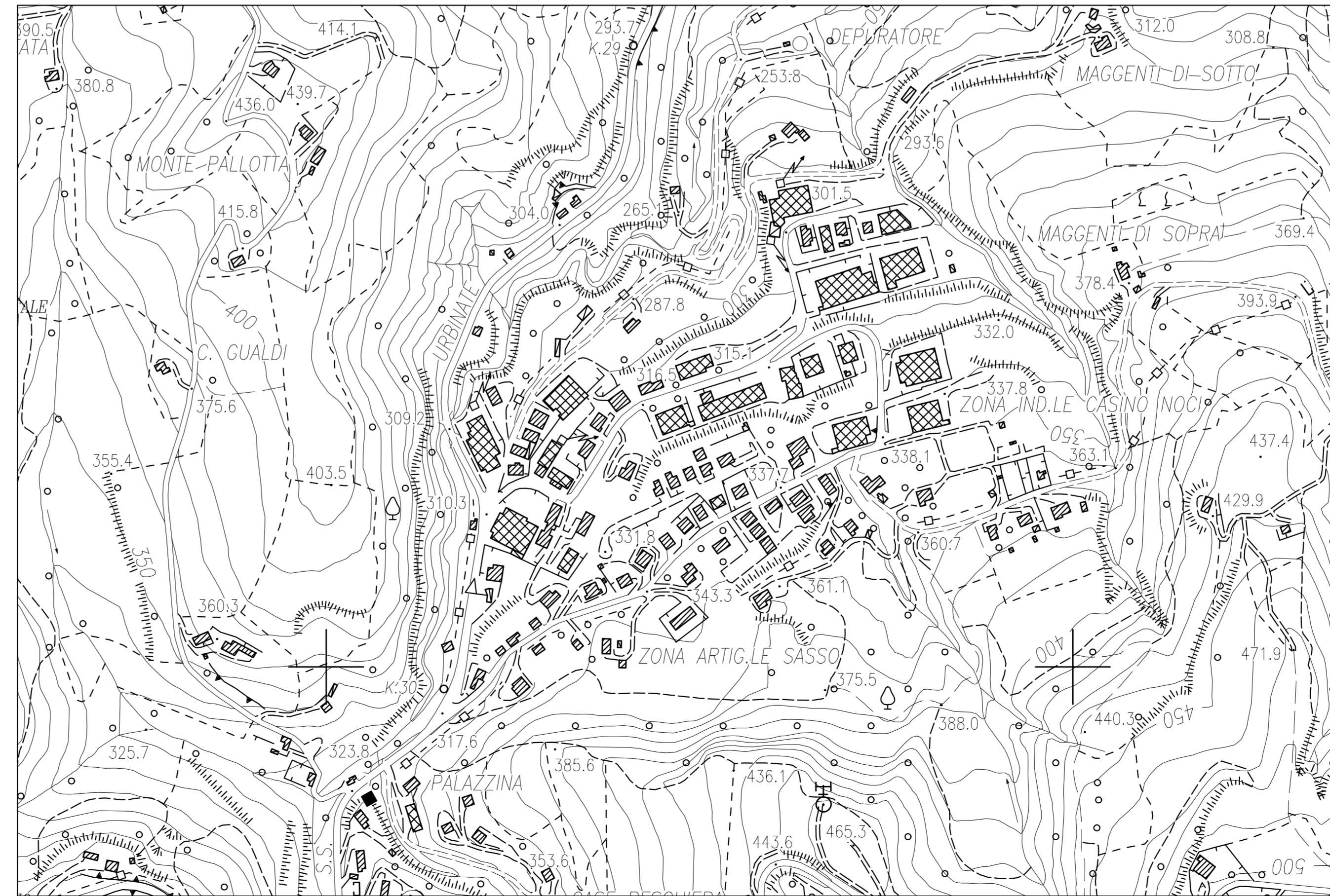
STRALCIO CARTA TECNICA REGIONALE SEZIONE 279080 scala 1:5000