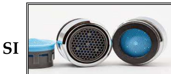
ESEMPIO DI DISPOSITIVI ROMPIGETTO

INSTALLARE SUI RUBINETTI DISPOSITIVI ROMPIGETTO CHE, MESCOLANDO L'ACQUA CON L'ARIA, CONSENTONO DI RISPARMIARE LA RISORSA IDRICA PUR DISPONENDO DI UN FLUSSO DI AGEVOLE IMPIEGO